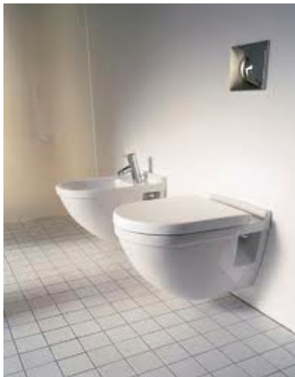
Hänge- Wc / Bidet mit eingebautem Spülkasten