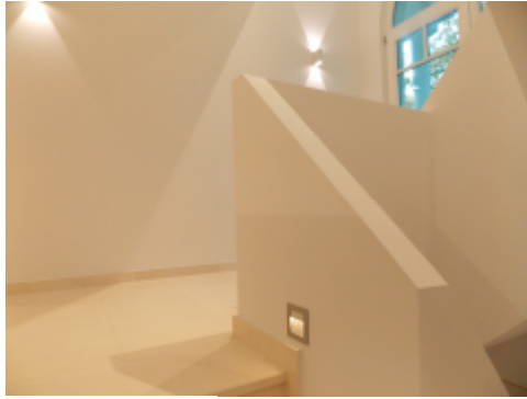
Einbaustrahler Flat Frames Curve Inkl. Leuchtmittel