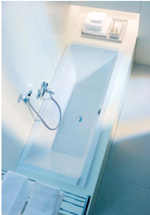
Acryl- rechteck- Wanne 180 L 180cm/ B 80 cm/T 52 cm

Hersteller: Saniku Modell: Kingston Farbe: weiß