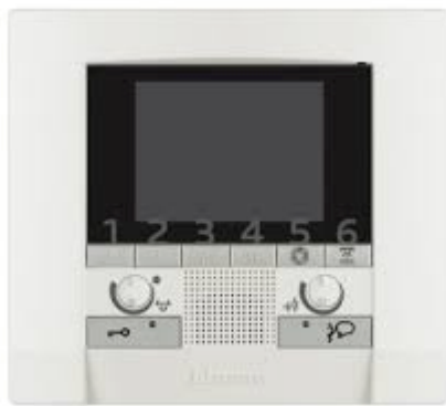
Video Gegensprechanlage mit 1 x Haustelefon je Wohnung mit Bild und externer Kamera und Einbaulautsprecher für Briefkasten, Firma Renz, mit Sprachfeld und Klingel Unterputz in Edelstahl