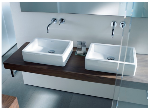
Aufsatzwaschtisch - Masterbad 60cm x 38 cm

( Anordnung und Anzahl nach Planzeichnung )