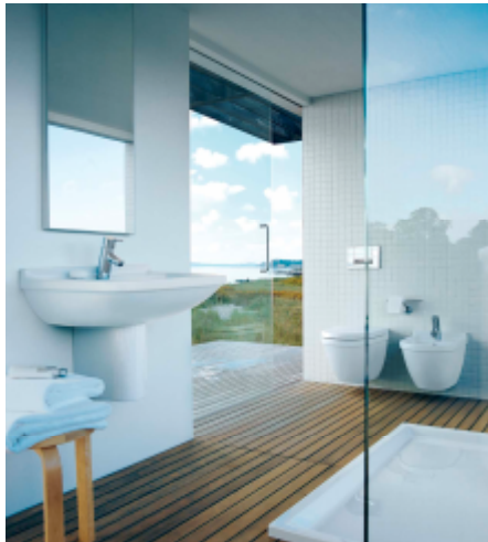
Waschbecken– Kinder Bad