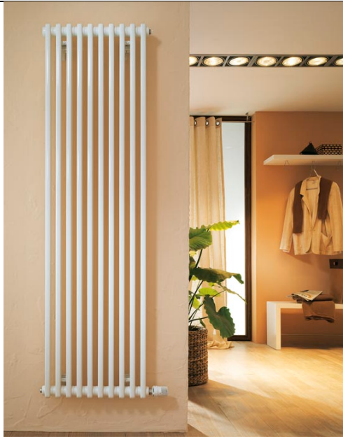
Wandheizkörper Firma Kermi oder gleichwertig Einzelraumregler mit Temperatureinstellung