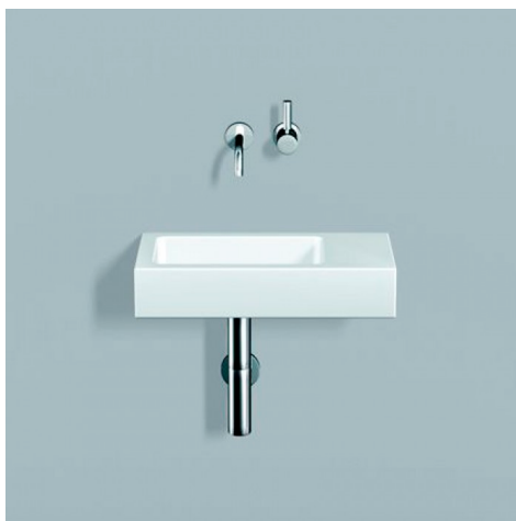
Alape Waschplatz XS - Gäste WC 60cm x 38 cm

( Anordnung und Anzahl nach Planzeichnung )