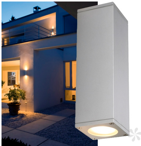
Aussenleuchte Theo „up and down“ Inkl. Leuchtmittel